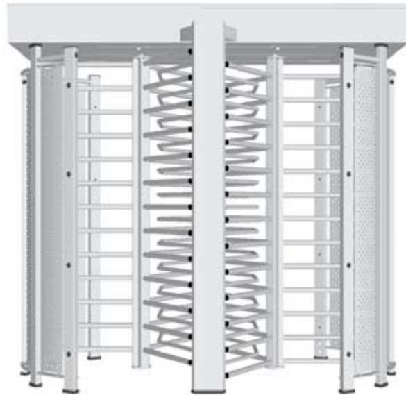
TRS 372 Passage double